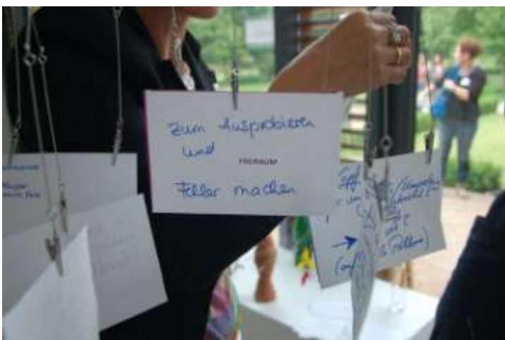
Rückmeldungen aus den Workshops