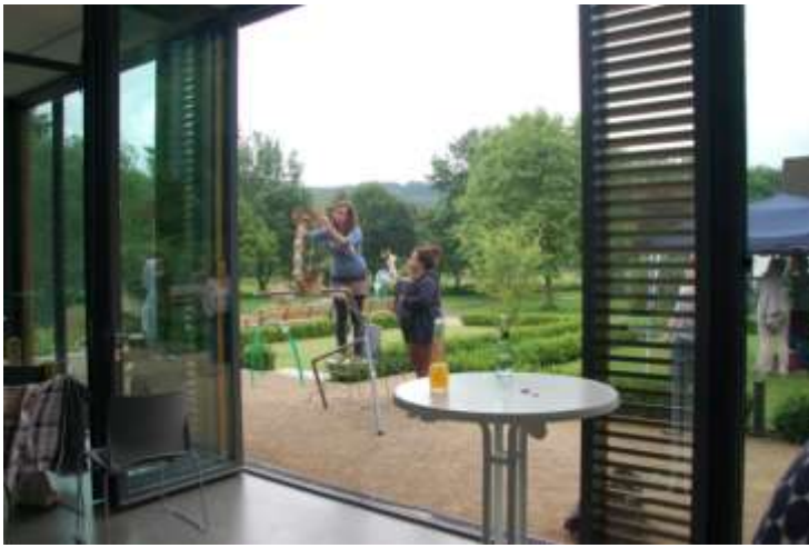
Räume öffnen – Heraustreten – Neues wagen.