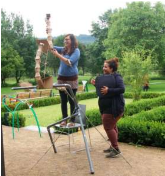
Mit Störungen umgehen lernen – Neu denken, Stützen einbauen, Hilfe annehmen, flexibel bleiben